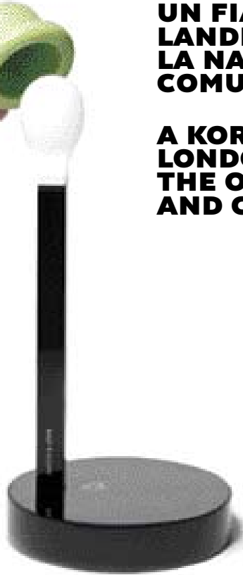
BD LIGHTING: LOVEBOY DESIGN PARK WOO SUNG PARAMMUN

UNA PICCOLA LAMPADA A FORMA DI FIAMMIFERO, SULLA CUI CAPOCCIA SI PUÒ CALZARE UN CAPPELLINO COLORATO OPPURE UN PICCOLO DIFFUSORE TRONCONICO. IL PROGETTO DEL COREANO PARK WOO SUNG FA LEVA SU GIOCO E SORPRESA, AFFIDANDO ALL'UTILIZZATORE IL COMPITO DI SVELARE L'OGGETTO E LA SUA NATURA INASPETTATA.